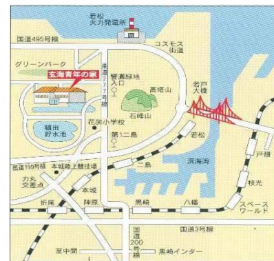
北九州市営バス二島經由脇田または若屋行 響灘緑地入口下車徒歩10分

【編集後記】季節はすっかり秋ですね。秋といえば、やっぱり食欲の秋です！秋の味覚、さんまに栗、ぎんなん、たくさん美味しいものを食べて、食べて、食べて秋を堪能したいと思います！（いよっぺ）