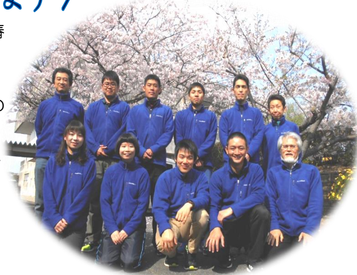
北九州市立玄海青年の家スタッフ一同

利用者の皆さんに気持ちよくすごしていただけるよう、所員が一丸となって対応いたします。皆さんのお越しをお待ちしています。